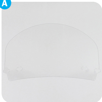
Teil A: Gesichtsschild Part A: face shield