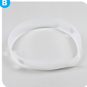
Teil B: größenverstellbares Befestigungsband Part B: size adjustable fastening strap