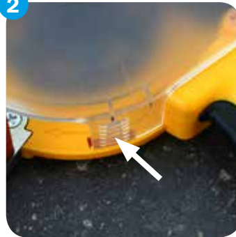
Drücken und aufklappen Press and open