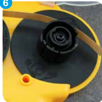
...und dann nach hinten führen. ... and over left wheel to the back