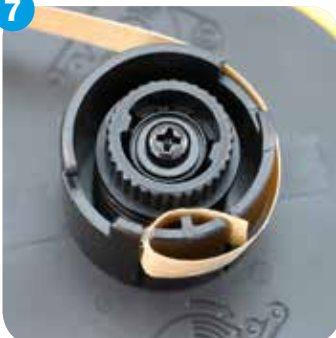
Trägerpapier in hintere Rolle einfädeln Secure end of the tape through slots in right wheel