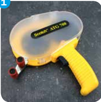
Scotch ATG-700 Handabroller Tape gun